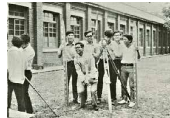
▲ 1970年左右的土木工程科測量。

1972年教育部著手修改「專科學校法」，簡化專科學校的修業年限與名稱；整理職業學校、專科學校與技藝學校，使三者連貫形成技職教育體制。教育部在1975年停止二專免試保送，採用全面聯招；1976年修正公布新〈專科學校法〉，是對中華民國來到臺灣三十年來，各種「因時」、「因地」置宜的紛亂教育體制之規範，解決新式專科學校成立，卻無教育法規相應之窘況。茲引其中相關數條如下：