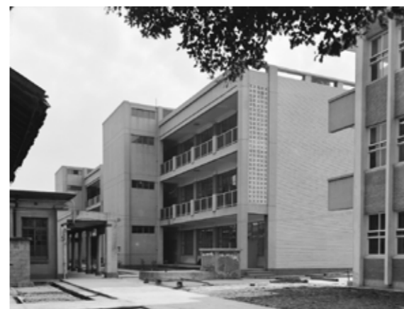
▲ 1963年落成的美援校舍一直持續使用迄今。

簡言之，從1970年代後期起，高中職實質完成分流，以大學聯招、三專聯招與二專聯招進行對高中、高職學生的篩選。其中，臺北工專五年制招收初中及後來義務教育的國中生，性質類似日治時期小學畢業以高等科二年級資格考入臺北工業學校修讀五年，可以說是戰後臺灣的美式學制下，新式五專蘊藏日本舊制實業學校五年學制的精神，引領風潮之下，後續許多五年制專科學校紛紛成立。