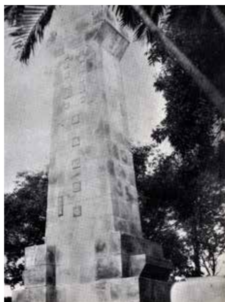
▲ 1950年校園矗立升格紀念塔（今已不存），約在該校現科研大樓後。