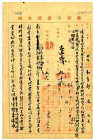
▲ 1947年9月懇請臺北工業職業學校遞升為專科學校的公告。

臺北工職也開啟「追循」省立工學院升格腳步，同年奉省教育廳核准，成立「臺灣省立臺北工業專科學校籌備處」，並招收電機科一班，修業年限三年，此一專科學校原本應在1947年正式成立。但是這