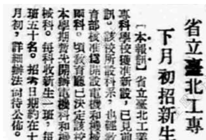
▲ 1948年9月14日及9月21日《公論報》報導省立臺北工專已可開辦。