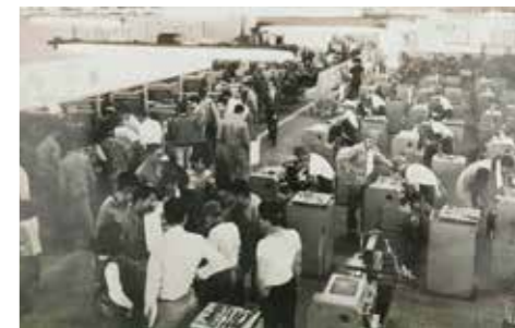
▲機械科學生實習課程。左圖為鑄造實習，右圖為車床及鉋床實習。

招）；1950年增設初級部電機科（1956年停招）。1969年設置電子設備修護科，1970年校名變更為「大同高級工業職業學校」。由於校風嚴格，連教師都須「朝八晚五」，期間不能走出校門一步，有「大同軍校」之稱。