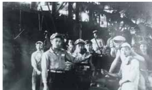
▲大同工職初級部機械科學生在校機械實習工廠上實習課。