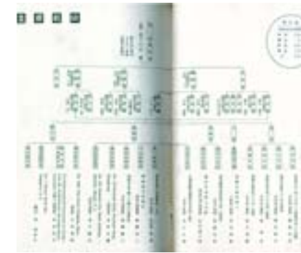
▲1939年臺灣拓殖株式會社社務組織圖。

在於策畫如何加強臺灣與「南支南洋」之關係，以便在「南支南洋」地區培植日本之經濟勢力，「南進」意識可說比先前更為明確強烈。為了規劃正確的「南進」政策，會前乃根據「南支南洋」地區之調查資料，彙編成四十餘冊之報告書，包含糖業、林業、礦業、金融、貿易、運輸、教育、新聞、醫療等各方面，而後參照報告書擬定計畫書，提出大會討論，其研討的各項議案為：（1）「南支南洋」貿易之振興案；（2）企業及投資事業之援助案；（3）發展工業案；（4）改善金融案；（5）改善交通設施案；（6）文教設施改善案等。