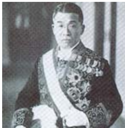
▲臨時產業調查會會長石塚英藏總督。

1931年「滿洲事變」爆發，致使日本開始積極在中國展開所謂的「進出」活動，對於南方事務的關心也逐漸高漲。而此時期的臺灣也由於農業飽和、臺灣與南洋地區產業之間的競爭關係，以及「滿洲事變」後日本進入「準戰時階段」等因素，基於軍需品現地準備之需要，殖民地臺灣的經濟角色乃由農業轉向工業發展，1934年日月潭水力發電工程完工後，臺灣進行工業化的條件更形完備。隔年10月總督府乃趁「始政四十週年」之機，召開「熱帶產業調查會」，試圖對於臺灣「工業化」及「南進」政策進行討論，並決定設立特殊會社作為「南進」政策的代行機關，儘速推展海外事業，協助南洋的日本人企業。