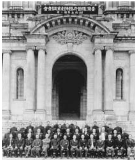
▲1930年臺灣總督府臨時產業調查會委員會合照。