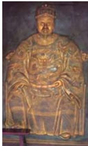
▲圖 4：懋德宮內的鄭成功坐像浮雕及〈鄭成功祭祀記〉碑文。

▲圖 3：嘉慶 14 年（1809）淡水河西岸平原漳泉械鬥示意圖。（資料來源：李雲雷，〈鄭成功祭祀記〉，碑文刻於蘆洲懋德宮正殿內，1902。）