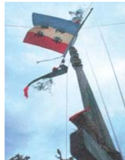
▲圖 5：燈篙上迎風飄揚的祈安三色旗。

國姓醮的祭典費用由居民共同出資的「丁口錢」負擔，不僅是蘆洲人的共同盛事，也是一種強化地緣意識的祭祀活動，深深影響著蘆洲的聚落發展史。