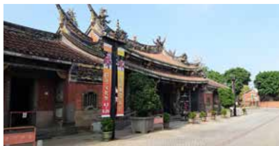
▲ 1896年，「臺灣總督府國語學校第三附屬學校」創設於大龍峒保安宮。

在利用總督府公文類纂時，有時關鍵字不正確可能就找不到什麼資料。例如在網路搜尋「大龍峒公學校」資料就有限，可先瀏覽維基百科看是否有較脈絡性的資訊，因為校名的變遷很大，因此從google輸入「大龍峒公學校」，會出現大龍國民小學，從「校史」可看到完整的介紹，結果出現：1896年8月29