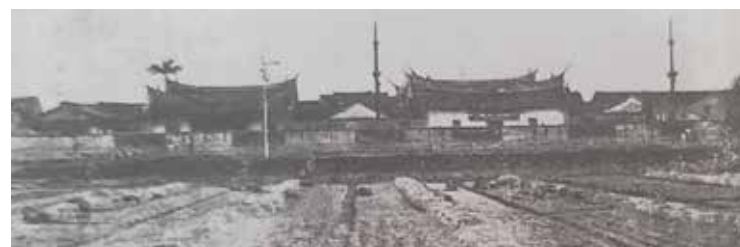
▲大龍峒陳悅記老師府宅。

三所附屬學校，芝山巖因「六氏先生」事件成為日人在臺教育的原始地，艋舺與大稻埕為臺北的二街市，其設校的考慮應有些背景。此後，大龍峒公學校因學區太大，陸續分設大安分校、朱厝崙分校。這些分校的設立，皆要有大龍峒區長提出的申請。