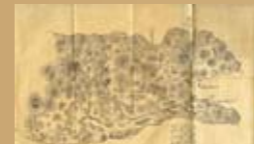
依據陸軍軍醫長瀨時衡等人見聞，所繪製的臺灣南部圖 長瀬時英，〈明治七年任職醫誌〉（廣島，1885年）