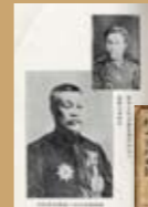
擔任陸軍大佐(上) 及臺灣總督(下)的 樺山資紀 藤野清之助，〈臺灣史と樺 山大將〉（東京：國史刊行 會，1926年）