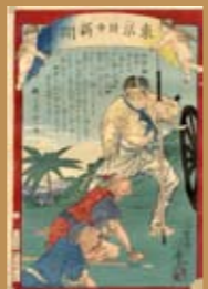
東京日日新聞所刊牡丹社討伐版畫 一畫師芳雄繪，〈東京日日新聞152號〉（東京： 興亞閣，年代不詳）