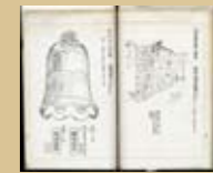
右：一百多年前的要塞；左：龍山寺的梵鐘 石坂莊作，〈北臺灣之古蹟〉（臺北：石坂文庫， 1923年）