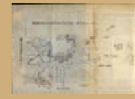
基隆附近戰備配備圖 戶川樞吉，〈近衛師團戰報詳報〉（1895年，印刷本）