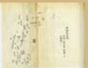
雲林縣內略圖 《舊雲林縣制度考》（年代不詳，寫本）