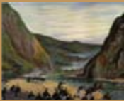
1874年石門戰場之役畫帖 小早川篤四郎，〈臺灣歷史畫帖〉（臺南：臺南市 役所，1939年）

日本調查事業的展開，源自於歐美移植過來的近代化政策，以及歐美殖民地經驗的影響。1871年，發生琉球難民被臺灣南部原住民殺害事件。以此一事件為契機，1873年日本政府派遣水野遵、樺山資紀等人來臺進行調查。1874年，出兵臺灣討伐牡丹社。其後，日本當局仍不時派人至臺調查。例如，1879年的美代清濯，1885年的黑田清隆與東鄉平八郎，以及1888年的小澤德平、安原金次等人到臺灣調查；1881及1891年，駐上海、福州領事上野專一兩度來臺進行貿易調查。1886、1888年，有平尾壽喜及藤江勝太郎調查茶業概況。1888、1894年，有宮里正靜及松本柳右衛門調查糖業生產概況。1893年，門田正經、稻垣滿次郎等人來臺調查臺灣的航路。1894年，尚有波江野吉太郎調查樟腦產銷。