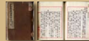
《步兵第四旅團陣中日記》 當地近思，〈舊政府時代建設供石樺木陳其他調查書〉（嘉義：縣誌 編輯委員會，1901年）