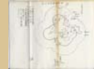
澎湖島要塞區域圖 井田顯應，〈澎湖島土記〉（1911年，寫本）