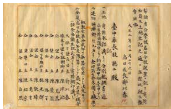
▲烏日分校設置寄附金與土地承諾。

從學校成立的沿革，可看到官方政策的影響，以及學校與地方社會間關聯。其中，從「犁頭店公學校烏日分校」，透露了過去犁頭店與烏日兩地間的歷史關聯。