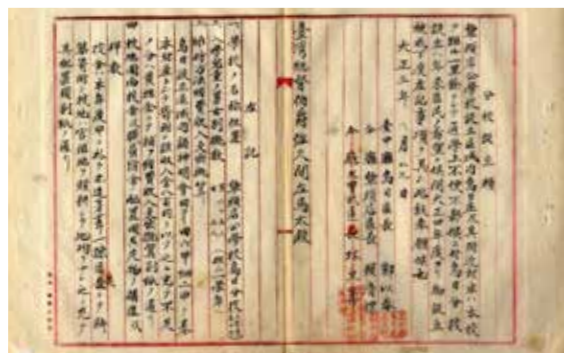
▲烏日分校設立請願。

臺中烏日國民學校是一所有百年歷史的小學。學校的歷史與地方社會有著密切的關聯，透過探究國民學校的歷史，可作為觀察地方歷史的一把鎖鑰。