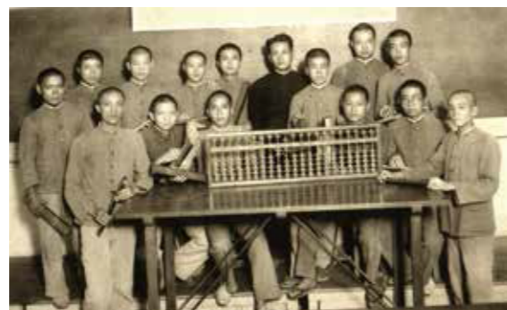
▲臺北二商學生與具代表性的校園文物—算盤。