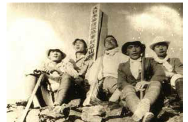
▲臺北二商學生攀登新高山（今玉山）。

山岳部也會相約一起以輕裝攀登新高山（今玉山），足以見得成員具有不錯的膽識與強健體魄。這些還不滿二十歲的臺北二商學生能順利攻克高山，即使以現在的標準來看，都是很簡單的成就。此外，臺北二商學生也會與同學相約出遊，像是參觀臺北公會堂（今臺北中山堂）、臺灣總督府博物館（今國立臺灣博物館）、新公園（今二二八紀