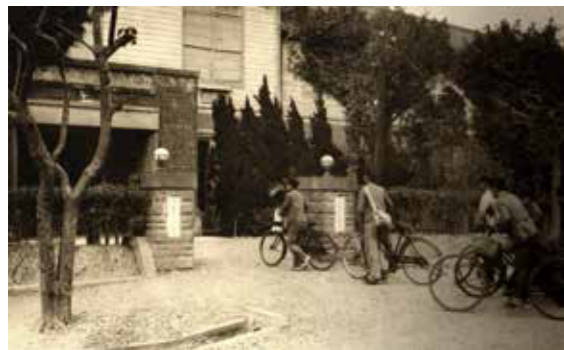
▲左側門柱為臺北二商校名。