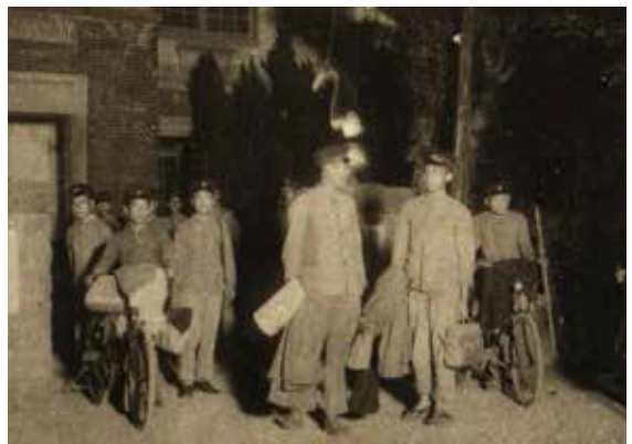
▲臺北二商學生的下課景象。