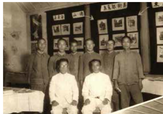
▲臺北二商學生整理中國東南沿海資料。

種，是相當重要的特色；再加上本科的「歷史及地理」，將學習範圍鎖定在東亞和南洋地區，其人才培育的目的及發展方向相當清楚。