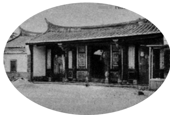
▲舊總督府官舍，私立臺北盲啞學校。

1930年，木村謹吾獲選參加世界盲人會議。該屆會議於1931年在紐約舉行，日本遴選出三位與會代表，分別是