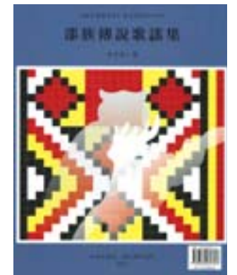
▲《邵族傳說歌謠集》／中央研究院語言研究所，2011。

臺灣南島語言的調查研究前後歷經一百多年，是經過國內外許多人的努力所累積起來的成果，並且陸續發現許多語言的現象只見於臺灣，不見於臺灣以外的南島語言，而目前研究者以國內人才最多。因此，臺灣也就成為國際南島語言研究的一個重鎮。