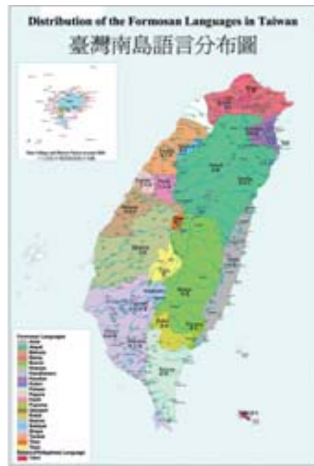
▲臺灣南島語言分布圖。（中央研究院計算中心 GIS 組繪製）

南島語言曾經遍布於臺灣全島各地，從平原到高山都有，其中大約有一半屬於平埔族的語言。臺灣的平原大部分都在西部和西南部，只有一小部分在北部（臺北盆地）、東北部（蘭陽平原）和東部（花東縱谷平原）。在西部和南部平原