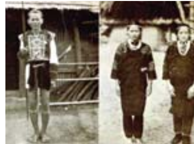
▲《臺灣高砂族系統所屬の研究》介紹原住民的圖片。

的各種平埔族群，因為最早跟外界接觸，從明末清初以來就逐步漢化，他們傳統的語言和文化在清代後期就已消失殆盡，只有開發較晚的埔里盆地一帶和東部縱谷平原還能保留一些。其中，只有三種平埔族語言一直到二十一世紀初都還保存，包括：在西部平原內陸地區的巴宰語（埔里）和邵語（日月潭），以及在花東的噶瑪蘭語。已消失的各種平埔族語言，僅存一些文獻資料。