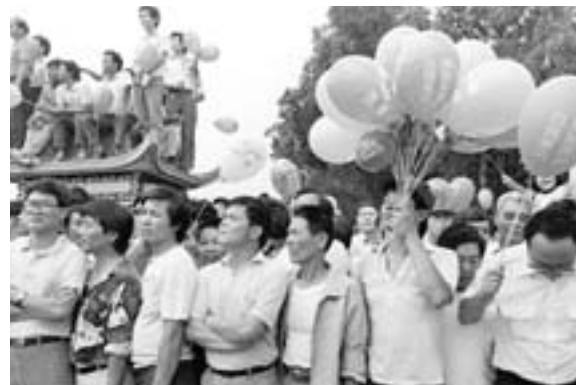
◀美麗島事件深化解嚴前後臺灣民主進程的動力。圖為1985年「519只要解嚴，不要國安法」遊行活動。

這些政治及民主訴求，經由大審透過國內外媒體的詳細報導，突破戒嚴時代臺灣內部的資訊封鎖，完整傳播到海內外，不僅感染許多知識分子重燃追求民主的熱情，也對一般民眾產生民主啓蒙，深化解嚴前後臺灣民主進程的動力。