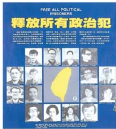
▲美麗島事件後，支持反對運動人士製作海報，呼籲釋放所有政治犯。

從美麗島大逮捕以來，輿論一路追剿美麗島人士，將其視為「暴徒」，使得「以暴易暴」的氣氛不斷滋長。血案發生後，社會氛圍趨於溫情和緩，媒體不再煽風點火，而鼓吹珍視民主價值、唾棄暴力，