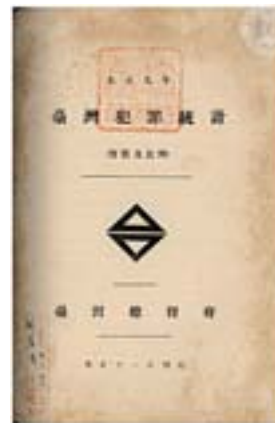
▲封面，《臺灣犯罪統計實數及比例大正九年（1920）》，1922年。

種族，大部分的統計表僅區分為內地人（日本人）、本島人（臺灣人）、外國人（以清國人/中華民國人占多數）。日治時期臺灣住民90%以上為臺灣人，因此犯罪人數上本島人占絕大多數，以