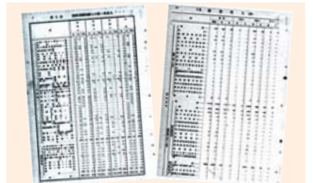
▲〈種族及體性別人口萬二付犯人〉，《臺灣犯罪統計實數及比例大正九年（1920）》，1922年。 ▲〈籍別犯人（續）〉，《臺灣犯罪統計實數及比例昭和十七年（1942）》，1943年。

其他，關於性別、犯罪地、量刑、累犯、犯罪人的教育程度、年齡、出生地、婚姻狀態、犯罪原因（如：憤怒、復仇、嫉妒）、都會/鄉村犯罪人口、阿片相關事項等，《臺灣犯罪統計》均有詳盡的統計，實數與比例均有；且每個統計表不限於上述所提之單一事項，可能數個事項並陳調查，例如「種族別犯人」中，不單僅計算每種族的犯罪人數，就其犯罪罪名也一併統計在內；亦有各地區的犯罪罪