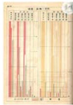
▲〈犯罪卜種族ノ關係〉，《臺灣總督府第三回犯罪統計書（1907）》，1909年。

1930年為例，本島人犯罪人數達32,000多人，內地人僅800多人、外國人1,500多人。但若從每萬人中刑法受刑犯人數（刑法犯/萬人比）來看，臺灣人的犯罪比例自1905年至1942年，從約32人/每萬人，緩步上升到80人/每萬人左右，最高紀錄不過百餘人，不但低於外國人（270餘人/每萬人，至640餘人/每萬人），日治前期也低於日本人的犯罪比例（百餘人/每萬人，下降至16人/每萬人）。