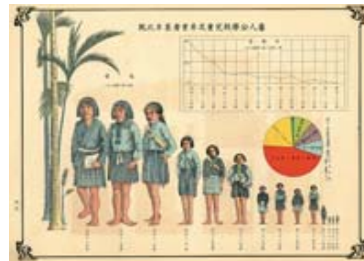
▲歷年蕃人公學校兒童及畢業者比較表。

為取得學子身體狀況資料，1910年4月，總督府同時對小學校、公學校、總督府國語學校、總督府中學校及總督府高等女學校，發布「身體檢查規程」，規定校醫必須於每年4月和10月，對學生進行身體健康檢查，為此，官房統計課還設計