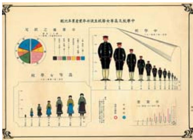
▲歷年中學校及高等女學校學生及畢業人數比較表。

日治時期，日人將西式教育制度引進臺灣，五十年間，接受新式教育的臺灣學子持續成長，從官方的教育統計中，可清楚的呈現教育的變遷趨勢。現今可見日治時期的教育統計資料，依據性質可分為四類：一、為根據〈臺灣總督府報告例〉編製的《臺灣總督府統計書》和《臺灣總督府學事年報》；二、為人口調查中的教育項目；三、為觀察學子健康情形編製的《臺灣各種學校生徒及兒童發育統計》；四、為地方的綜合統計書和學事要覽。 一、〈臺灣總督府報告例〉中的教育項目