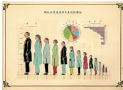
▲歷年公學校兒童及畢業人數比較表。

為確實掌握臺灣人口實況，1905年起，總督府以臨時臺灣戶口調查之名義，實施人口普查，1920年起正名為國勢調查，五十年間總計實施過七次，調查內容也包含教育項目。