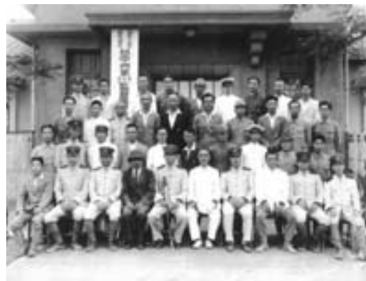
▲1940 年國勢調查臺中州第 51-53 監督區調查員講習會紀念照。