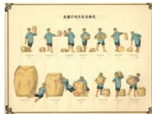
▲1899 年至 1911 年臺灣製糖逐年統計圖表。

清代的臺灣，雖然由各級官僚加以統治，但他們是屬於西方社會學者韋伯（M. Weber）所謂的家產制官僚，與近代科層制官僚相比，專業性與切事性相當有限；同時，這些官僚基本上缺乏直接統治個別民眾的能力，而是必須倚賴各種社會團體與社會領導階層來間接統治。與此相反，