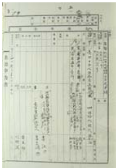
▲臺北縣竹北一堡九甲埔庄土地申告書。（交通大學四河流域研究計畫服務資料）

當代各國在規劃政策時，很習慣參考政策相關的統計資料，藉以認識現狀或推估未來的可能變化，以便擬定適當的政策；企業經營者也會透過傳播媒體取得政府或非政府機構的統計資料，用以擬訂企業自身的經營政策；同時，一般人也常利用各種經濟指標來決定自己的經濟行為，例如決定投資或賣掉某支股票。簡單來說，統計資料是當代社會與自身的主要依據。當然，利用某些數量性訊息來認識事物且決定行動，並非當代社會的特產，傳統社會的人也利用某些訊息做出決定，但過去人們生產與應用數量訊息的方式與近代社會