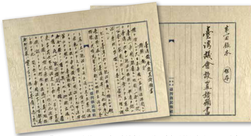
▲蔡培火所保存第一回〈臺灣議會設置請願書〉的抄錄版本。