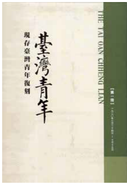
▲《臺灣青年》藉「文化協會」的各項活動，啟蒙臺灣的民眾。

在〈我島與我等〉一文中，蔡培火從三個層面推演其論述，第一是從自然資源來看，他認為天賜臺灣的環境非常優異，促進全島工商業發達是我們的天職。其次從地理位置分析，他強調臺灣是東洋海運之要衝，我們必須努力使其