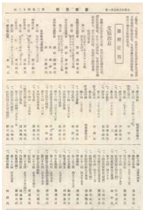
▲《臺灣民報》刊出的文協消息。

《臺灣民報》輸入臺灣，甚受臺灣島民歡迎，因此10月將雜誌《臺灣》併入《臺灣民報》，改為旬刊，一年後再改為週刊。在臺灣的文化協會