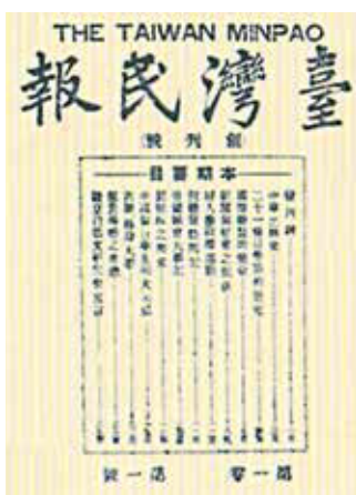
▲《臺灣青年》卷頭之辭，臺北，▲《臺灣民報》創刊號。 東方文化書局 1973 年復刻。

今年（2021年）是臺灣文化協會創立一百周年。本文嘗試從臺灣文化協會設立到消滅前後，其相關周遭機構、特別是「臺灣民報」系列刊物：《臺灣青年》、《臺灣》、《臺灣民報》、《臺灣新民報》，以及文協的機關報《會報》，來了解臺灣文化協會存在前後時期，所謂的「文化啟蒙」應如何詮釋。另外，用「臺灣新民報社」和其後的「興南新聞社」編輯出版三種版本的《臺灣人士鑑》「趣味」欄位內容，理解當時的知識分子或仕紳，他們的「文化」與「趣味」之間的關聯。