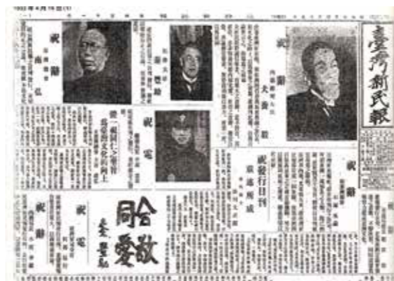
▲《臺灣新民報》，國立臺灣歷史博物館 2015 年復刻。

《會報》，創刊號因載有蔣渭水的〈臨床講義〉以及〈苦悶的靈魂〉，被禁止發行，第二期起改為先檢閱才能出版，且不得刊登時事；經過多期禁止，到第八期終止發行，改為委託在東京的《臺灣民報》刊行文協會報。在同一時間，臺灣亦發生12月16日的「治警事件」。