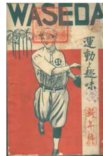
▲本西憲勝《運動と趣味》第3卷1號》，臺北，1918。

坪內逍遙認為日本在日俄戰爭之後，應從明治期的「文明開化」、「物質維新」，走入「精神維新」的「文化生活」，創立以「音樂、演劇、演講、繪畫、建築、庭園、遊戲、流行等」為主的文化，這是「精神維新」、「文化的改良運動」。主導《臺灣人士鑑》「趣味」欄位的東京留學生或許受坪內逍遙《趣味》雜誌影響而有此發想。1910到1930年