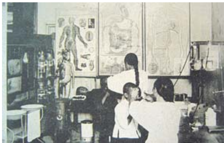
▲學校設有衛生室，展示各種衛生資料及掛圖，並進行身體檢查。圖為員林公學校。

日本統治臺灣以後，引進近代學校制度。近代學校很重要的特徵是集眾教學，一方面爲了管理學校中的眾多學生，一方面也爲了確保學校作爲近代國家機關的行政績效，利用各種簿冊、記錄管理學生，記錄學校行事便成爲近代學校行政運作的重要工作。每一個學生入學以後，都會有一張學籍卡，詳細記錄個人的出生年月日、家長姓名、住所等，此後每一年的上課（缺課）日數、各科學業成績，乃至身體檢查的各項數據，都會被一一登記在這張表單上，學校便是透過這些表單來管理學生。身體檢查即是這種管理體系的重要項目。