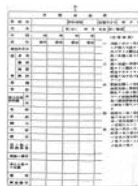
▲「學校生徒兒童身體檢查規則」（1921）中規定的身體檢查票樣式。

另一方面，新規則發布的同時，以總務長官通牒的形式說明學校身體檢查規則要注意的事項，其中最值得注意的是，要求學校要將檢查結果做成整體的統計表，同時提供給本人作爲參照，讓他充分自覺自己的健康狀態與平均的差異，並能進一步根據健康指導，自動自發的努力提升體位。這個改變顯示，學生不再只是被檢查身體的被動存在，而是有義務讓自己身體健康的主體。到了戰爭時期，到了戰爭時期，身體檢查不只是個人掌握自己身體狀況或促成健康發育的工具而已，它也是國家要求國民自己增進健康，從而爲國家所用的道具。