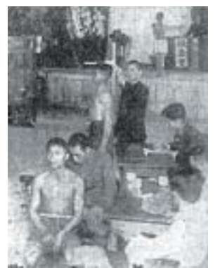
▲志願兵的身體檢查。（《臺灣日日新報》1943/12/21）徵兵或志願兵的身體檢是為了決定是否適合當兵而做的篩檢，但學校的身體檢查不是為了檢查而檢查，而是為了利用其結果而檢查。