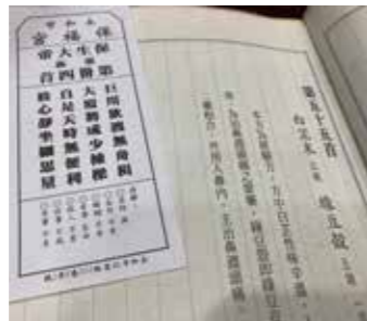
▲過去廟宇出藥籤，現在醫學發達，已提供一般籤文。