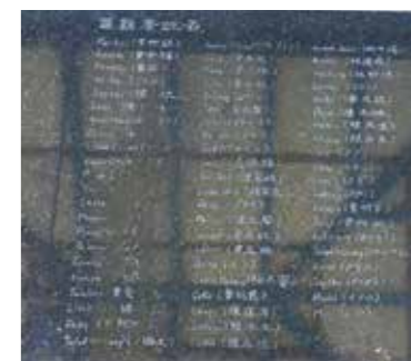
▲遺族與研究者費盡心力才找出罹難者姓名，可見醫療史料的重要。