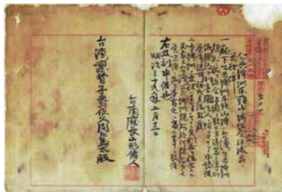
▲公共埤圳虎頭山埤組合。

此外，三大灌溉圳路底下又有支圳數條，便利農田直接灌溉。在二十世紀初期，灌溉流域包括大目降里的大目降、知母義、頂山腳、北勢、洋仔、竹仔腳、崙子頂、礁坑子，以及廣儲東里區域，灌溉面積計田四百二十六甲、園十九甲；至1928年時，已達五百五十