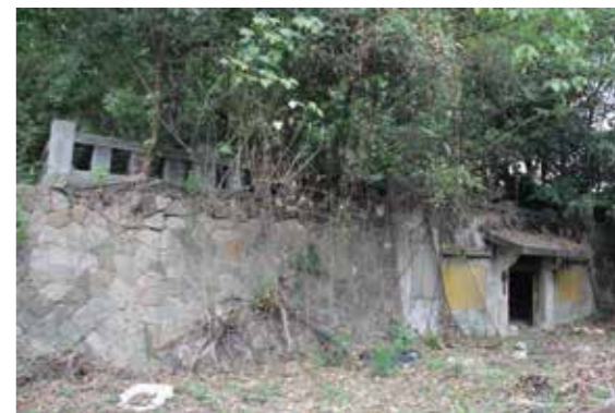
▲新化神社地下遺構。

近年臺南市政府對大目降·新化投入經費，設立發展「大目降文化園區」，並對大目降之母的虎頭埤積極進行管理建設，例如休憩區與青年活動中心的整頓，或原新化神社參道、石燈籠、神橋的重新規畫整理等。今日的虎頭埤逐漸恢復作為南臺觀光景點的容貌，卻已不復原始農田灌溉功能。