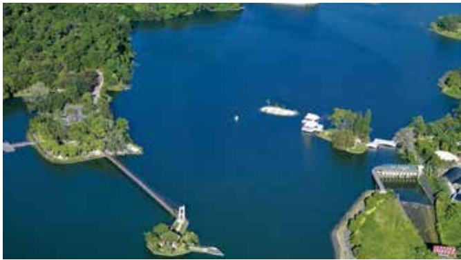
▲今之虎頭埤。

臺南新化的虎頭埤，原是大目降（新化早期名稱）最重要的農田灌溉水源，說它是「大目降之母」也不為過；自清道光年間建埤至今近一百八十年，有人稱它為臺灣第一座水庫，但虎頭埤是否可稱之為「水庫」，且是否為臺灣第一座？不無討論餘地。現今的虎頭埤是臺南市近郊著名觀光景點，一到假日即有眾多遊客湧入，或踏青或泛舟。藉由探究虎頭埤從清朝最初的私人建埤，到日治時期設置為公共埤圳，成為風景名勝，及至戰後周遭環境丕變，可一探臺灣埤圳隨時代演變的變遷過程。