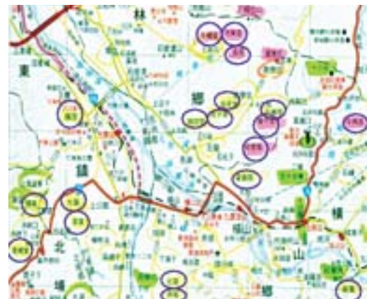
▲地圖三：新竹地區地名為「窩」的分布地區之一（芎林鄉、竹東鎮、橫山鄉一帶）。（陳鸞鳳，2005）

在客語地名用詞中，「窩」指的是像畚箕一樣的地形，多分布在河流中游、上游地區和河川支流的上游地區。地圖三中，新竹縣頭前溪中游兩側有許多支流，支流的上游及其附近可以看見相當多「窩」的分布，名稱有：牛欄窩、芎