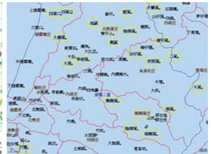
▲地圖四：臺灣堡圖之苗栗二堡的「窩」（局部圖）（陳鸞鳳，2005）

地圖相關網頁： 臺灣歷史地圖查詢系統： 檢索網址： http://webgis.sinica.edu.tw/website/htwn/viewer.htm