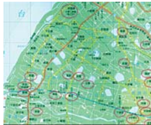
▲地圖二：新屋鄉沿海的「屋」地名。（地圖來源：臺灣地理人文全覽圖）

與族群有關的地名中，純客家人最常用的有兩個字，第一個是「屋」，第二個是「窩」。以桃園縣新屋鄉客家地名為例（地圖二），新屋鄉在桃園地區的「北閩南客」分布現象中，屬「南客」地帶，觀察新屋鄉西側（沿海一帶）地名中，最常出現的客家地名是「屋」。新屋鄉的「屋」聚落，有黃屋、彭屋、羅屋、上羅屋、何屋、下姜屋、莊屋、余屋、葉屋、黃屋、李屋、郭屋、歐屋等。而與