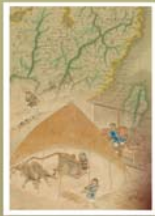
封面主圖／番社采風圖——糖廍 背景圖／臺灣古地圖